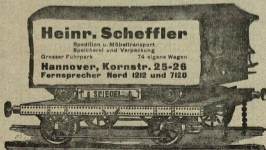
Maschinen- und Kesseltransporte

Hannover, Kornstr. 25-26 Fernsprecher Nord 1212 und 7120